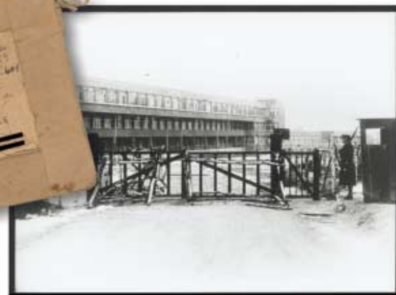
Photographie du camp d'Aincourt (s.d.).