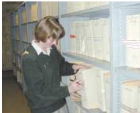
Une travée du Bureau Résistance au château de Vincennes.

série Q. Secrétariat général de la Défense nationale et organismes rattachés, 1944-1978 , index général, Vincennes, service historique de l'Armée de Terre, 2000. ▶ États des fonds privés (4 volumes) ; inventaires analytiques des témoignages oraux.