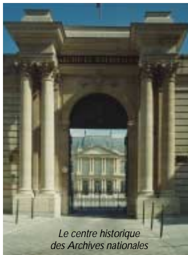
Le centre historique des Archives nationales