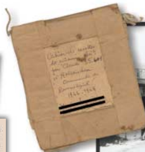
Cahier de recettes fabriqué par une déportée dans un kommando de Ravensbrück, 1944-1945.

Des archivistes professionnels vous garantiront une bonne utilisation des fonds que vous leur confierez. Ils veilleront à leur bonne communication en respectant le cadre légal qui prévoit toute une série de précautions en fonction du caractère du document (voir chapitre V C).