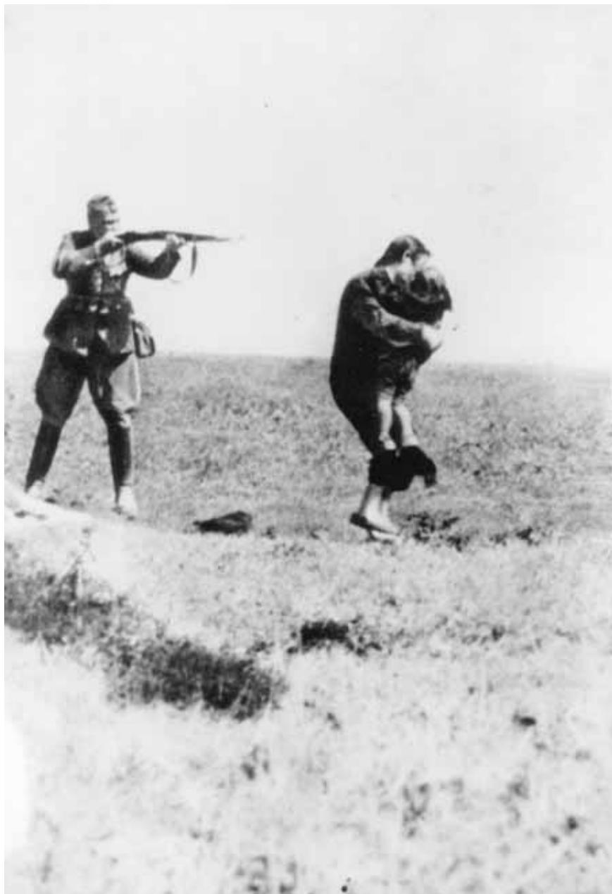
Soldat allemand exécutant une femme juive et son enfant, Ivangorod, Ukraine, 1942.