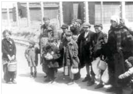
▲ Femmes et enfants juifs Hongrois jugés "improductifs", après la sélection sur la rampe d'Auschwitz-Birkenau, se dirigeant vers les chambres à gaz et les crématoires. Fin mai-début juin 1944.