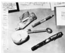
Objets divers de la résistance clandestine de Buchenwald.