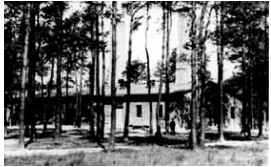
▲ Crématoire V. Auschwitz-Birkenau. 1943-1944.