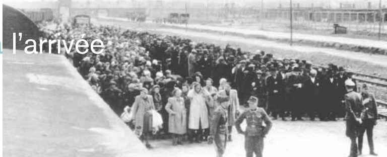
▲ Arrivée d'un convoi de déportés juifs hongrois à Auschwitz-Birkenau, sélection sur la rampe. Fin mai-début juin 1944.