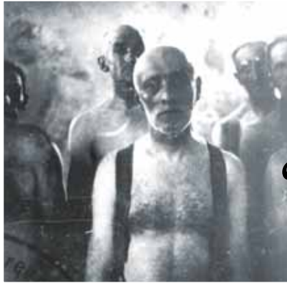
▲ Juifs dans un des camions à gaz de Chelmo. Pologne, 1942.