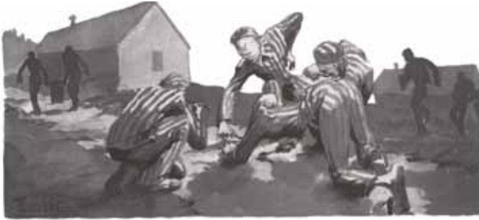
▲ Où la faim se faisait cruellement sentir au point de ramasser de la soupe tombée à terre. 1945. Dora. MAURICE DE LA PINTIÈRE