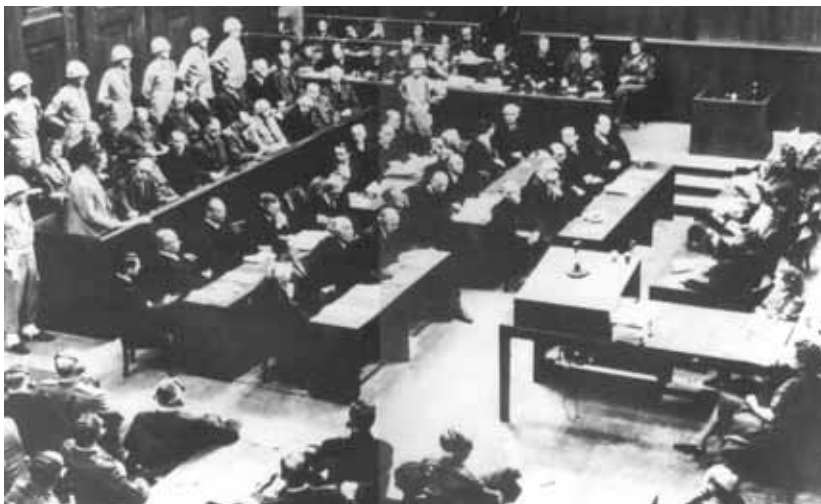
Responsables nazis au procès de Nuremberg, 20 novembre 1945 - 1 er octobre 1946.

« (...) Comme vous et moi, les responsables d'Auschwitz avaient des narines, une bouche, une voix, une raison humaine, ils pouvaient s'unir, avoir des enfants ; comme les Pyramides ou l'Acropole, Auschwitz est le fait, est le signe de l'homme. L'image de l'homme est inséparable, désormais, d'une chambre à gaz (...) »