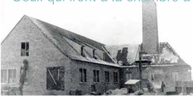
▲ Construction du crématoire II d'Auschwitz-Birkenau. 1943.