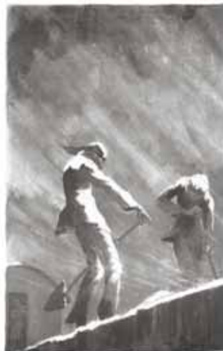
« OÙ, douze heures durant, il fallait lutter contre les éléments déchainés. 1945, Dora.

Primo Levi 174 517 Auschwitz III - Buna - Monowitz