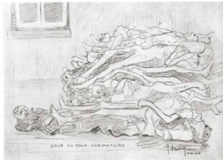
▲ Dans cette cour, il y a eu jusqu'à 1500 morts à pourrir au soleil. Buchenwald, février 1945. AUGUSTE FAVIER

“Mon frère est mort ! Mon frère est mort ! C'est un hollandais qui hurle, les yeux fous, l'air absent, en tenant dans ses mains la tête violacée de son frère qui vient de mourir à côté de lui, asphyxié... C'est affreux, je n'ose pas regarder, il me semble que je vais devenir fou. (...)”