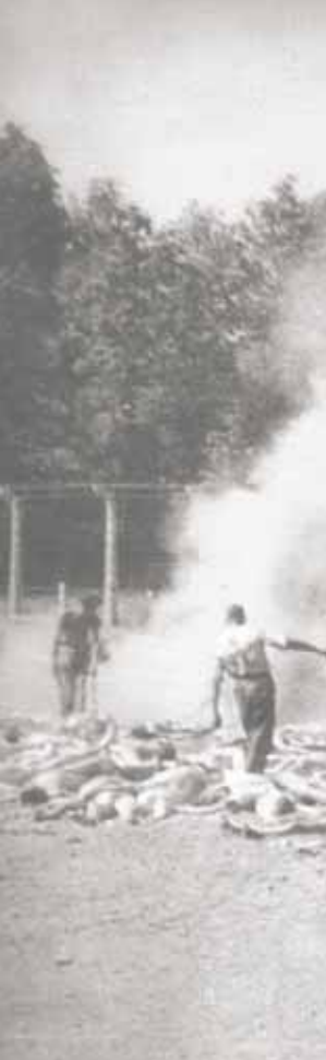
▲ Crémation des corps des détenus gazés dans des fosses d'incinération à l'air libre. Photographie réalisée clandestinement depuis l'intérieur de la chambre à gaz nord du crématoire V de Birkenau. Août 1944.