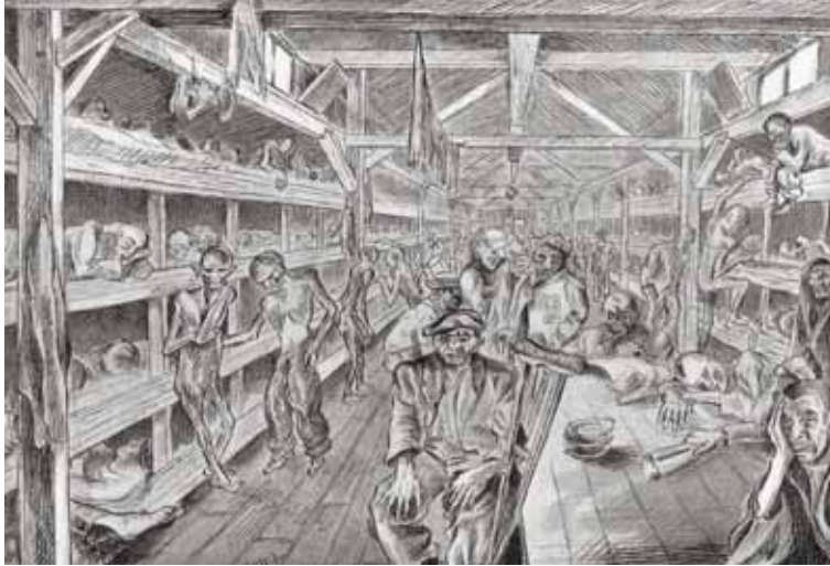
Block en bois dans le petit camp. De 1000 à 1800 internés vivaient dans une superficie de 25 m sur 8 mètres, 1943. Buchenwald. AUGUSTE FAVIER