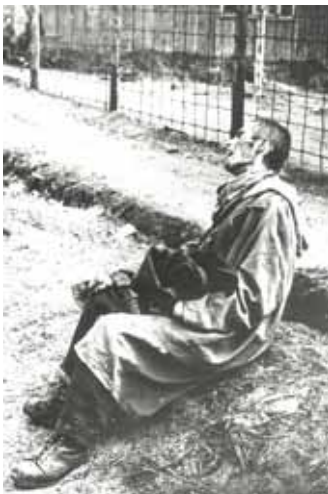
► Déporté épuisé à la libération du camp. Bergen-Belsen, 17 avril 1945.

Le pire, c'est la faim, Avoir faim, attendre la coulée chaude. Le pire, c'est le froid, Le froid quand on a faim, Le froid des affamés qui tendent l'écuelle Attendant tout du temps, N'attendant rien d'eux-mêmes. Le pire, c'est les coups, Les coups dans les reins. C'est aux reins que les genoux s'articulent. Douleur des coups, des corps sans genoux, Douleur aux reins après deux heures d'appel, Coups au réveil. Le pire c'est savoir Qu'on ne sait pas quand ça finira, Au matin de la libération Où chaque soir du désespoir. Le pire, c'est le voisin Qui tend sa face. Et sous nos yeux s'entrechoquent les dents. Le pire, c'est qu'on marche à reculons Dans des souliers pour