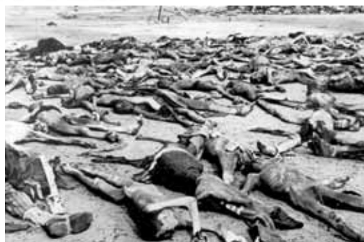
▲ Cadavres de détenus. Bergen - Belsen, 17 avril 1945.