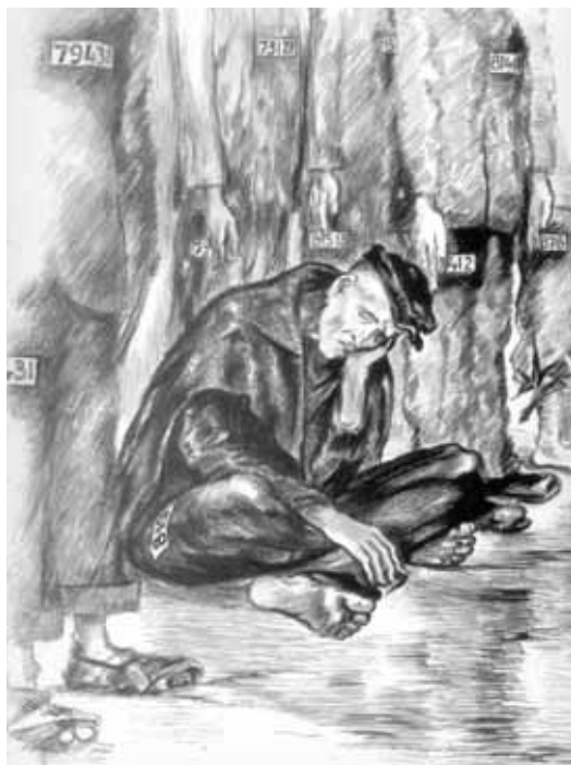
▲ De la série Les matricules Intérieurs des camps d'Auschwitz-Birkenau. Début des années 1990. GILLES COHEN

“Mon Dieu, je n’ai plus de vêtements sur moi, Je n’ai plus de chaussures, Je n’ai plus de sac, de portefeuille, de stylo, Je n’ai plus de nom. On m’a étiquetée 35 282 Je n’ai plus de cheveux, Je n’ai plus de mouchoir. Je n’ai plus les photos de Maman et de mes neveux. Je n’ai plus l’anthologie où, chaque jour, dans ma cellule de Fresnes, j’apprenais une poésie. Je n’ai plus rien. Mon crâne, mon corps, mes mains sont nus.”