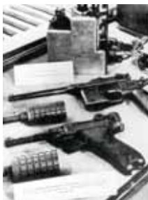
Armes de l'organisation clandestine de résistance de Buchenwald. s.d.

“Quelques coups de feu crépitent, mais la compagnie de choc atteint son objectif: la porte, le Bunker, les locaux administratifs sont investis. Les SS surpris, en proie à la panique, décampent à toute vitesse (...). Une joie intérieure bienfaisante, riche d'espoir fait vibrer tous nos combattants. Libres, nous sommes libres !”