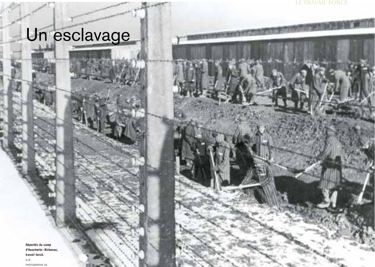
Déportés du camp d'Auschwitz - Birkenau, travail forcé. s.d.

“ Je me souviens de Königsgraben (les carrières du roi), peut-être un des pires Kommandos* (...) Nous transportons de la terre dans une sorte de brouette sans roues, un peu comme une chaise à porteurs, un devant, un derrière. Il fallait courir. Souvent la charge dépassait nos forces : un gars tombait. Alors le Kapo frappait, non pas l'homme à terre, mais le coéquipier plus costaud et encore debout, pour le monter contre son camarade moins solide. Parfois la manœuvre réussissait (...) Dans ce Kommando, nous ne rapportions pas à dos d'homme les morts et les blessés au camp. Ils étaient trop nombreux. Un camion venait les ramasser pêle-mêle. ”