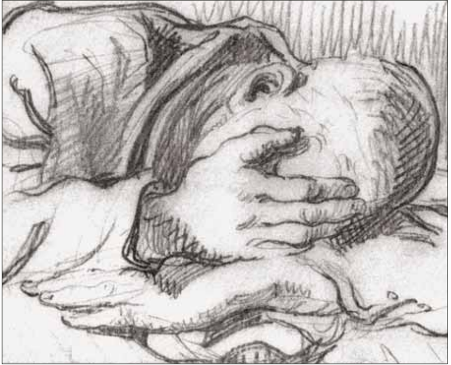
► Dépression. Buchenwald, 1946. BORIS TASLITZKY