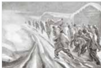
Les Déportés montent à l'appel (portant leurs morts et leurs malades), ils resteront autant de temps qu'il plaira à leurs bourreaux : 3 heures, 4 heures, 5 heures et parfois plus. Beaucoup mouraient ; il était défendu de porter secours à ces derniers. Buchenwald, janvier 1944. PIERRE MANIA

Margarete Buber - Neumann 4 208 Ravensbrück